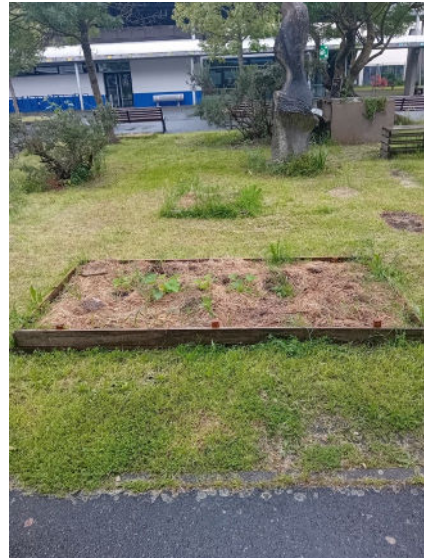
Massif de comestibles

Pour finir, des ajouts d'éléments décoratifs, toujours conçus à partir de matériau de récupération (bois, plastiques, métal) furent ajoutés pour égayer et donner vie à cet espace nature !