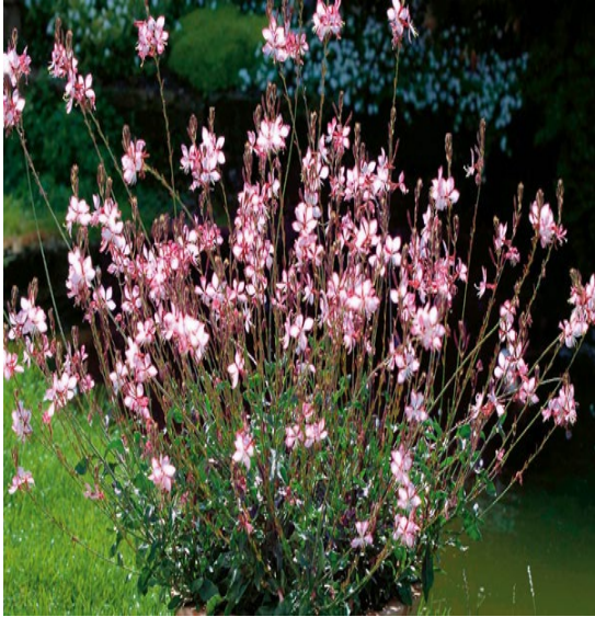
Gauras en fleurs