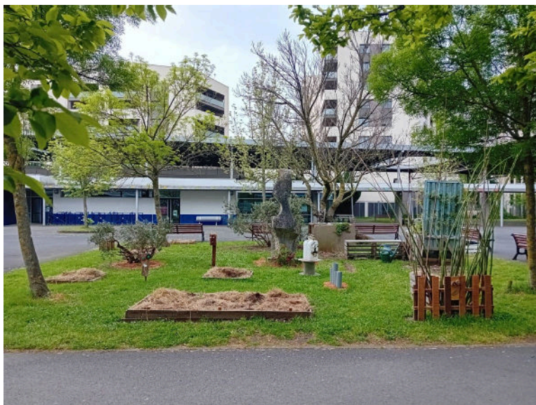
Vue d'ensemble de l'espace nature